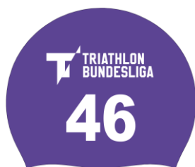
Beispiel einer Schwimmkappe